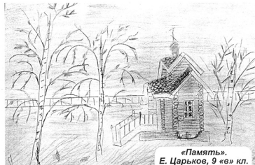
«Память» Е. Царков, 9 «а» кл. школа №5.

В этом аэроп все Мне нравится, Парки, скверы, дома, дворы, Здесь и лес, и речка-красавица, И, конечно же, люди – МЫ!