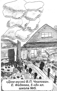
«Дом-музей В.П. Чкалова» Е. Федяева, 5 «б» кл. школа №5.

Чкаловск – аэроп небоной, Тихий, молчаливый, Но зато такой родной, Милый и любимый!