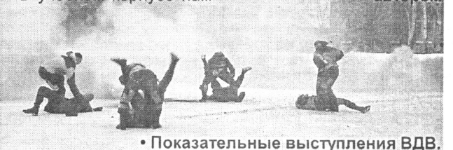
Показательные выступления ВДВ.

Материалы подготовлены членами клуба юных журналистов (руководитель Е. Кутейникова). Материалы размещены также на сайте газеты.