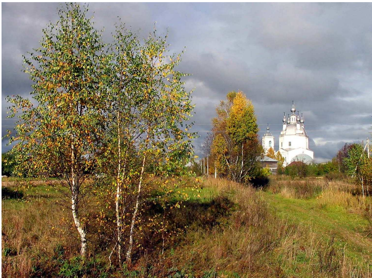
Сицкое. Храм Преображения Господня. Фото 2005 г.

(Д.А. Иванов. «Ландех», Изд. МИК, Иваново, 2004).