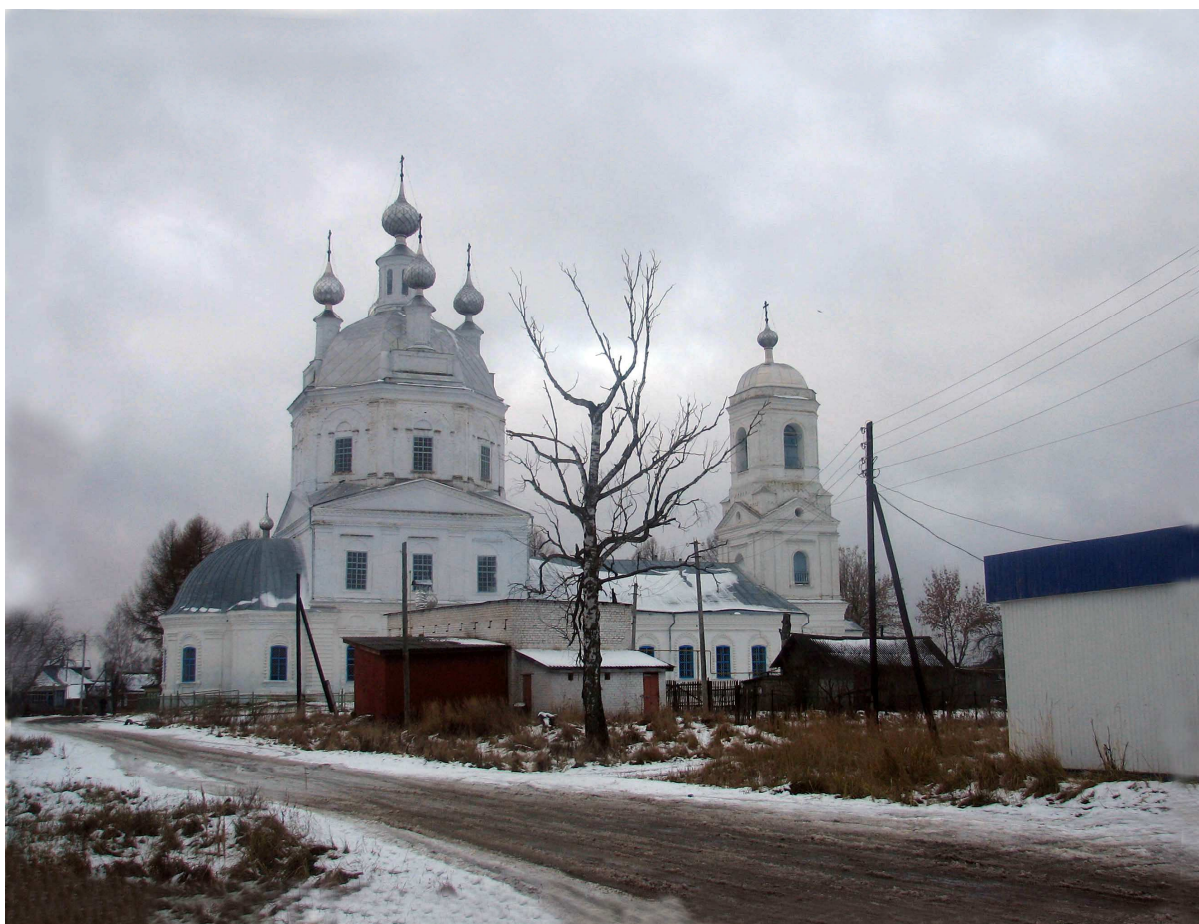
Церковь Преображения Господня, с. Сицкое. Фото 2005 г.

Ослепительно белый, он, блестя на солнце куполами, как будто парит над лесом, кажется манящим миражом, неизменно привлекая взор путника до тех пор, пока не покажутся домики села и ближних деревень.